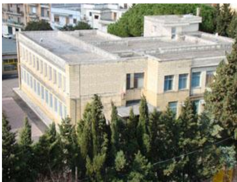
SCUOLA PRIMARIA (Padiglione Nord)