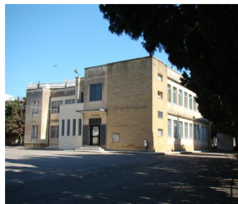
SCUOLA PRIMARIA (Padiglione Sud)