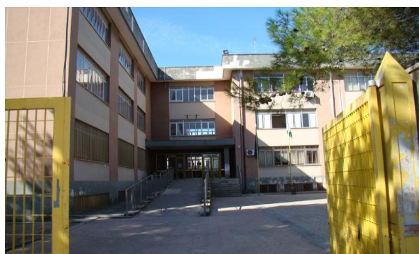
SCUOLA SECONDARIA 1° GRADO